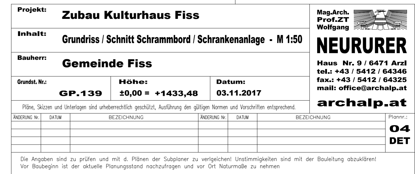
Schnitt obere Rampe